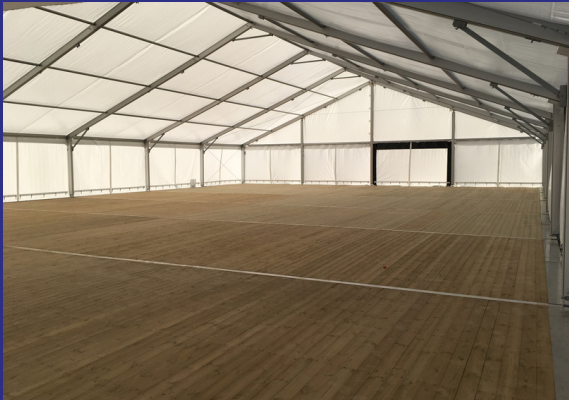
Chapiteau de soirée équipé en son et lumières