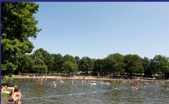
Camping au bord d'un lac avec plage de sable