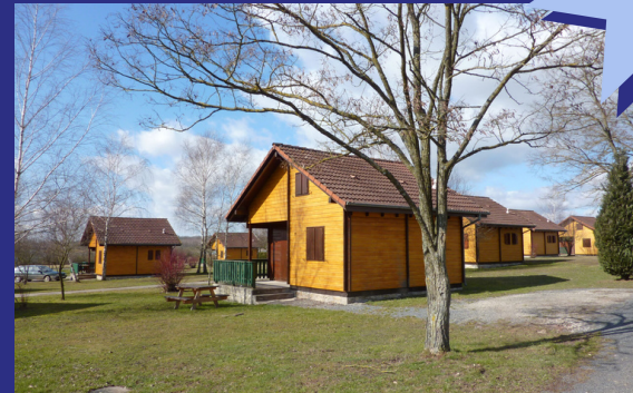
Hébergements confortables en chalet