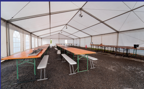
Chapiteau de restauration