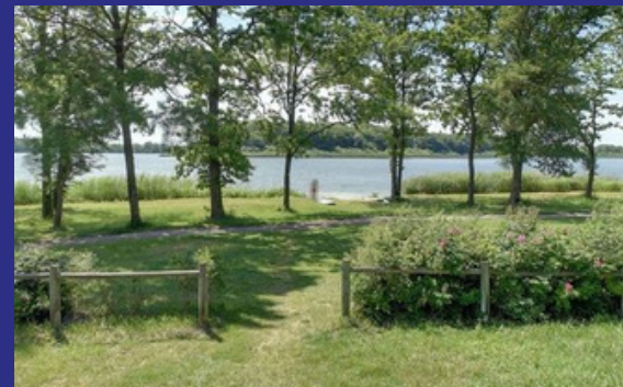
Grands espaces verts pour vos animations et aire de jeux